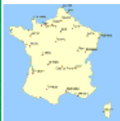
(une) carte de la France – la clim(atisation)